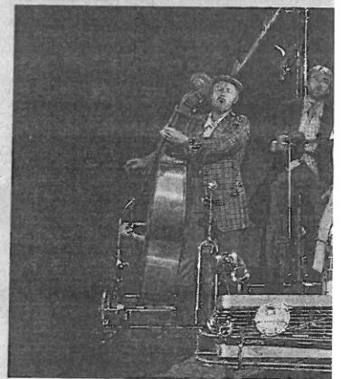
Les quatre participants à bord de la ligne de front en musique le long de la ligne de

En lien avec la pièce, deux actions de médiation culturelle en milieu scolaire sont organi-