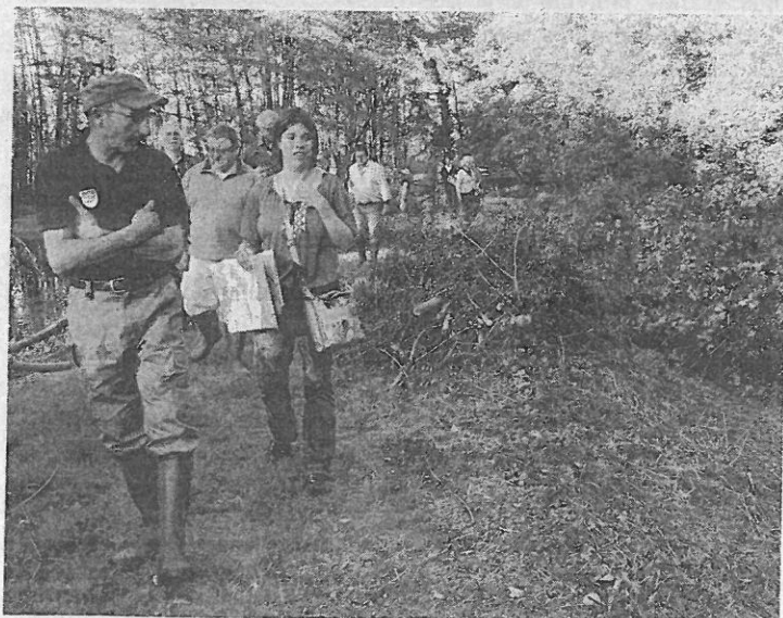
Vers la bonde de l'ancien étang de Beauregard.